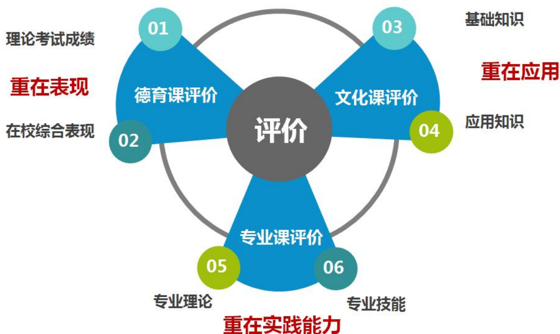
图 4：专业学习多元化评价模式